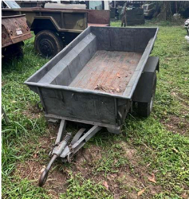
VRNE CARGA ANFÍBIA 1/4T