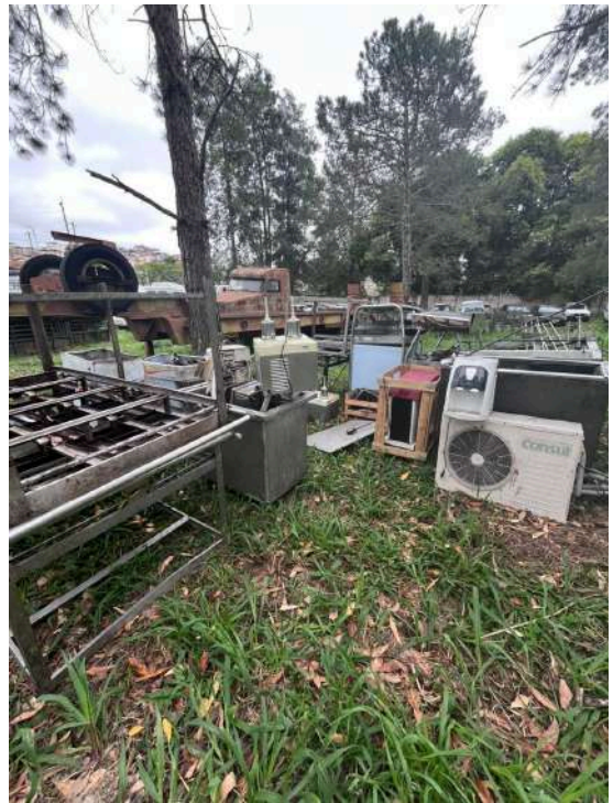
VTNE CAMINHÃO EMP GE LA1418/51 5T 4X4 MERCEDES-BENZ 1997 - 9BM384114VB118619