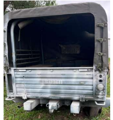
VTNE PICAPE EMP GE 130 4X4 LAND ROVER - SALLDKHS89A774417