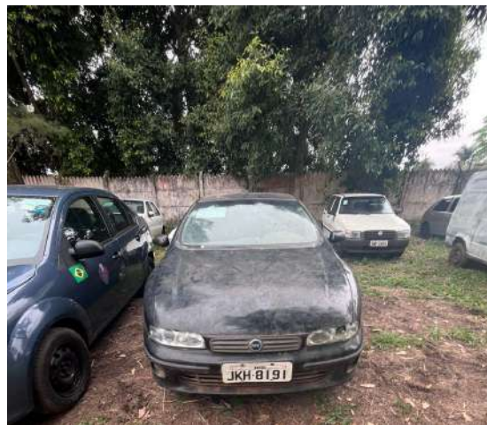
VTP AUTOMÓVEL EMP GE UNO MILLE ECONOMY 05PSG 4X2 FIAT 2006 - 9BD15822764807662